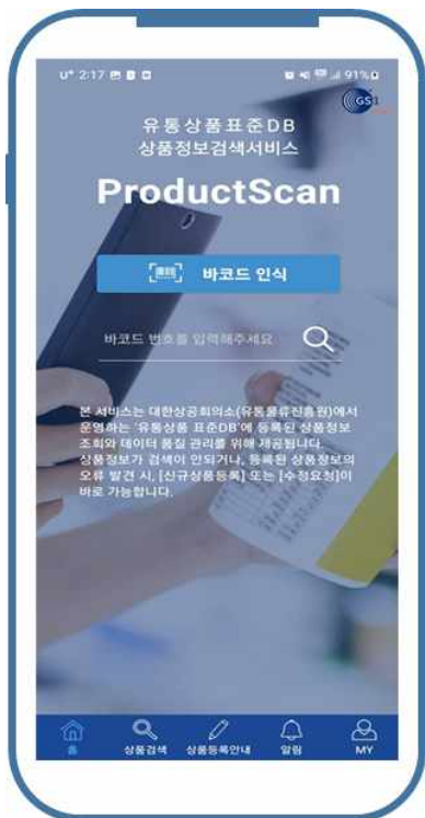
< ProductScan >